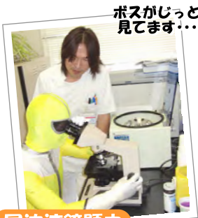
ポーズがじっと見えます...

広報戦隊3レンジャーが部署を訪問し、自ら体験したことをリアルにお伝えして行きます。第3回目は、アットホームな“検査科”にお邪魔しました～!