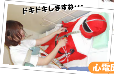
ドキドキしますね...