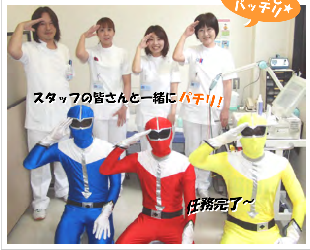
スタッフの皆さんと一緒にパチリ!