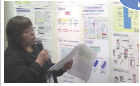
第3回 日本褥瘡学会九州地方学術集会

褥瘡対策委員会から「病院独自の褥瘡回診」のテーマでポスター発表をしました。今回当院独自の統一された経過表や、病棟・Dr.の連絡にオーガナイザー（調整役）を取り入れたことによる回診のスムーズ化、褥瘡風景等を紹介しました。他院からも、経過表への質問や、クリニカルパスに使用できる等の感想もいただきました。