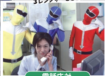
広報戦隊 3レンジャーでございます♪