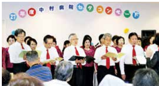
ニューライフ さわやかコーラス

セタコンサートを7月7日に行いました。ニューライフさわやかコーラスの歌声やSYTTカルテットのJAZZ演奏を聞き、楽しい一時を一緒に過ごすことができました。