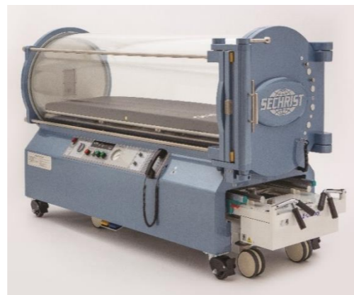
(HBO) Model 2800J 米国セクリスト社製の高気圧酸素治療装置