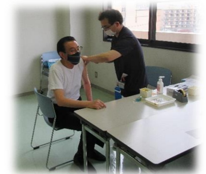
←院長先生もワクチン接種を受けました