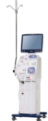
多用途透析用監視装置 DCS-200Si （日機装 HP より引用）