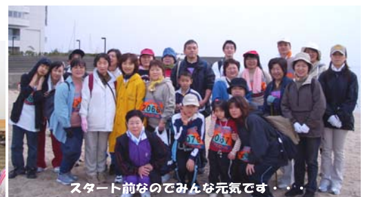
スタート前なのでみんな元気です