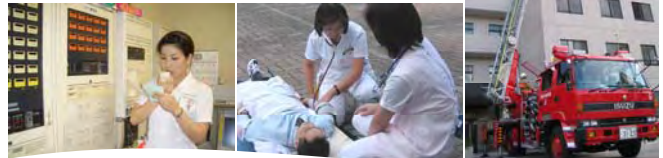
はしご車による救出訓練