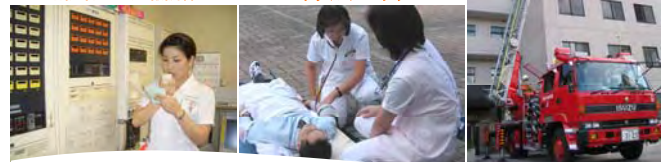
はしご車による救出訓練