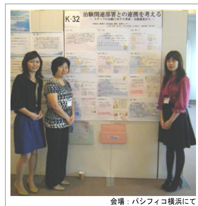
会場：パシフィコ横浜にて