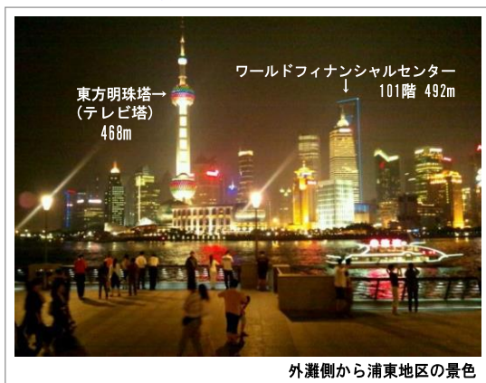
外灘側から浦東地区の景色

東方明珠塔は東京スカイツリーが出来るまで、アジア第1位の高さでした。東京スカイツリーは完成すると634mです。