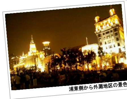
浦東側から外灘地区の景色

1900年代初頭に建築された、重要文化財の洋館が立ち並ぶ「外灘(ワイタン)」。ノスタルジックな夜景がステキですね。ビジネス街「浦東(プドン)」の近代的な建物と対照的です。