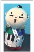
浜松市のゆるキャラ 出世大名家康くん

10月4日・5日の2日間、静岡県浜松市で開催された「CRC と臨床試験のあり方を考える会議」に参加しました。「響け、未来の医療へ！プロフェッショナルリズムのハーモニー」をメインテーマに、iPS細胞の臨床への応用をテーマにしたシンポジウム、医療機関における品質管理、CRCのキャリアパス、臨床研究等、治験に留まらず多彩な講演・セッション・セミナー等がありました。全国から大勢の医療機関・製薬企業・行政機関等の関係者約2,700人が集い、発表や活発な討論、意見交換が行われました。来年は9月12日・13日、兵庫(神戸)で開催予定です。