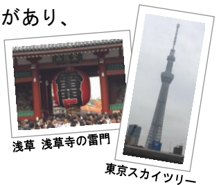
浅草 浅草寺の雷門